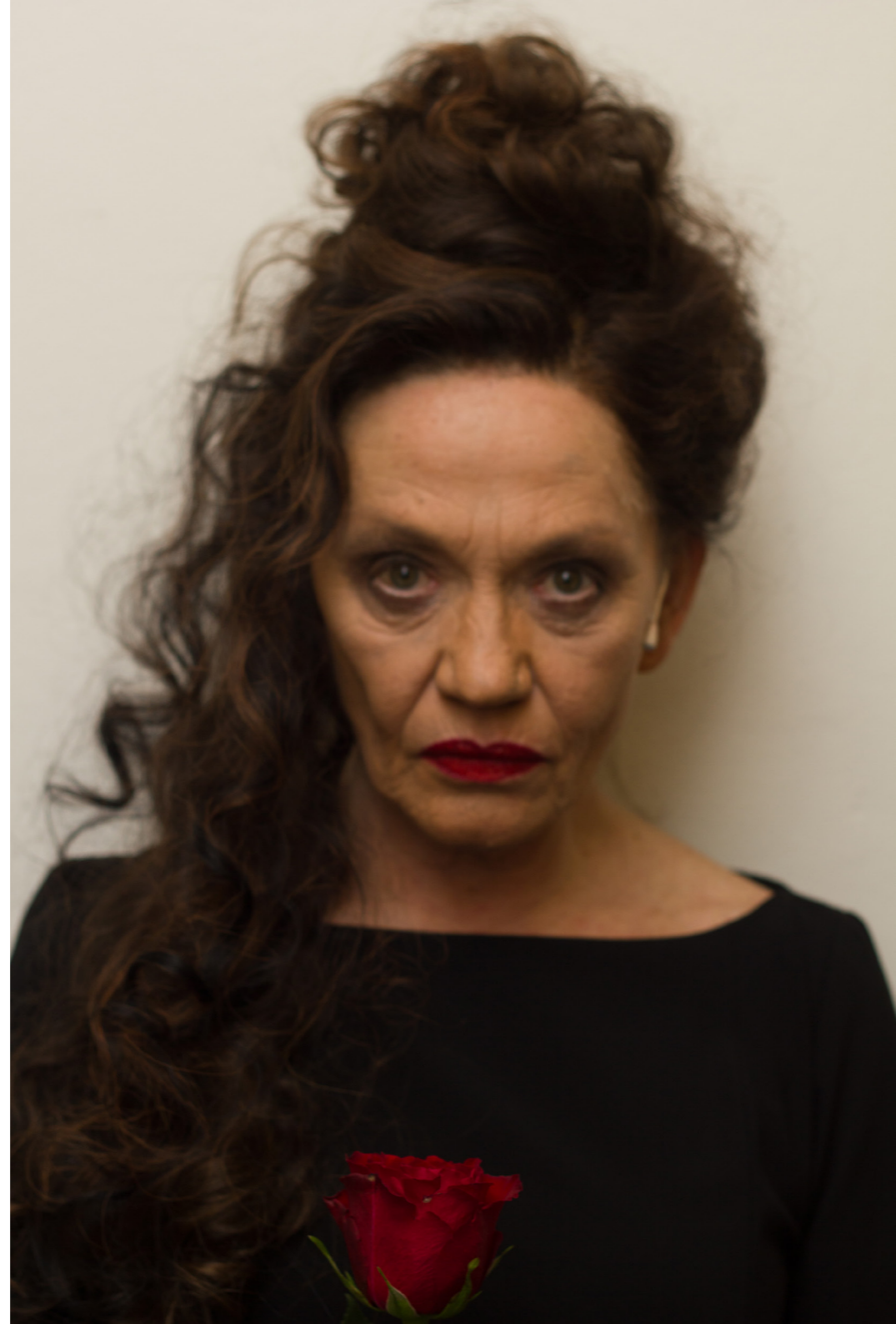
Karin Neuhäuser / Der Tod / Tomáš Jeřábek / vyšetřovatel / Don Giovanni: Letzte Party / Bílí psi a černý kočky / Thalia Theater Hamburg / Studio Hrdinů